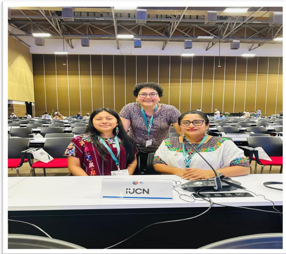
En esta imagen, los delegados de la Asociación Ak' Tenamit están participando en la Conferencia de Biodiversidad COP 16 , celebrada en noviembre en Cali, Colombia.

para prosperar. Estas colaboraciones forman la base de nuestro trabajo, y seguimos comprometidos con expandir y profundizar estas relaciones para generar un cambio duradero.